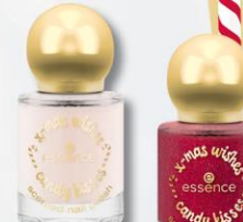
02 Apple-y Ever After